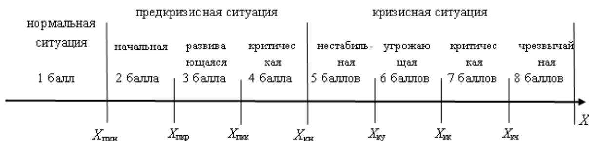
Рис. 1. Пример 8-и бальной шкалы кризисности для индикатора X.

Пример 8-и бальной шкалы кризисности представлен на рис. 1.